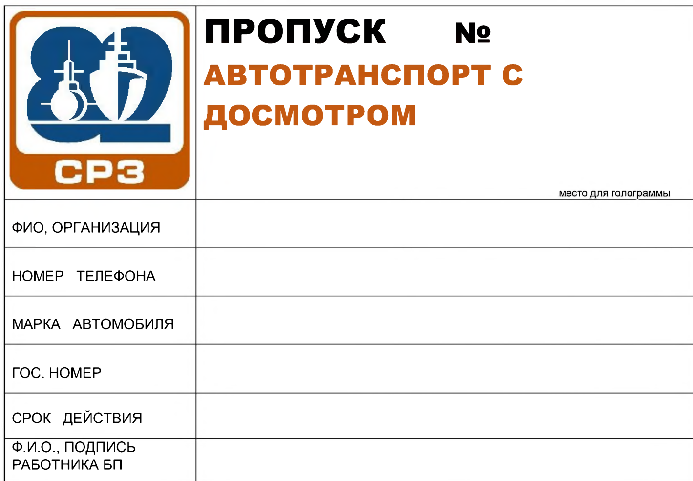
Рис. 12 Транспортный пропуск без права проезда КПП без досмотра Контролерами

Действителен при предъявлении его владельцем пропуска и документа, на основании которого выписан пропуск.